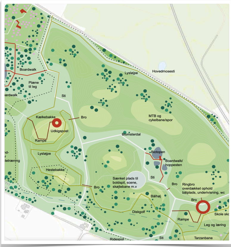
Sådan tænkes aktiviteterne. Området afgrænses af Hovedmosesti og jernbanen i nord, og Englebjergvej mod sydøst. Kort: Næstved kommune

Ideen om det kommende aktivitetsområde har vitterligt været længe undervejs. Gennem mange år har byggeri i Næstved kommune og det øvrige Sydsjælland skabt tonsvis af overskudsjord, som vognmænd har fragtet langt for at slippe af med.