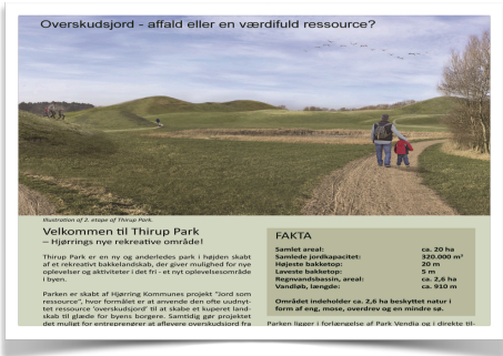
Overskudsjord - affald eller en værdifuld ressource?